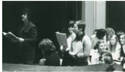
Probe zu Carmina Burana 1974