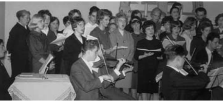
1963 in der Lutherkirche