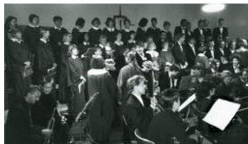
1996 Paukenmesse in St. Ansgar